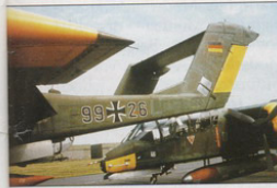
OBERN Die Broncos waren serienmäßig mit einem leichten Schleudersitz ausgerüstet, vor dem das rote Dreieck auf dem Rumpf warnt.

Montelimar / Frankreich (siehe FLUGZEUG CLASSIC 1/2001) und wird regelmäßig auch bei Airshows in Deutschland gezeigt. Man darf schon auf die Vorführungen dieser seltenen Flugzeuge gespannt sein, denn die Bronco ist verglichen mit anderen Zweimotorigen sehr agil und beeindruckt auf Flugtagen die Zuschauer vor allem mit einem sehr steilen Landeanflug sowie anschließender, extremer Kurzlandung. A.N.