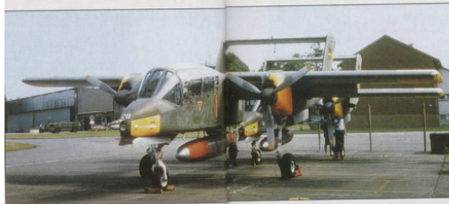
OBERN So standen im letzten Jahr die beiden zum Verkauf anstehenden Broncos am Fliegerhorst Faßberg, der auch eine ganze Anzahl weiterer ausgemusterter Luftwaffen- und NVA-Maschinen beherbergt.